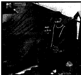
Dakloze met kind